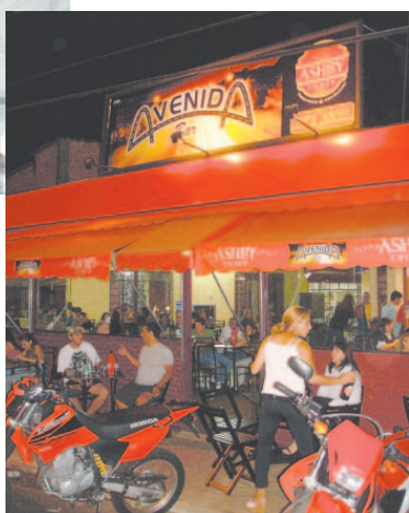
...Avenida Bar: Av. Dr. Carlos Burgos, 1645 - Amparo. Fone: (19) 3807-2022