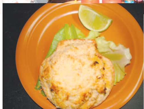
...a deliciosa Casquinha de Siri. Uma das exclusividades do Avenida Bar.