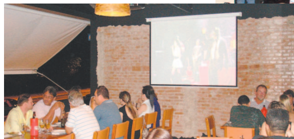
...Agora, um Supertelão, com o melhor do Futebol (Campeonato Brasileiro), à sua disposição. Venha Conferir!